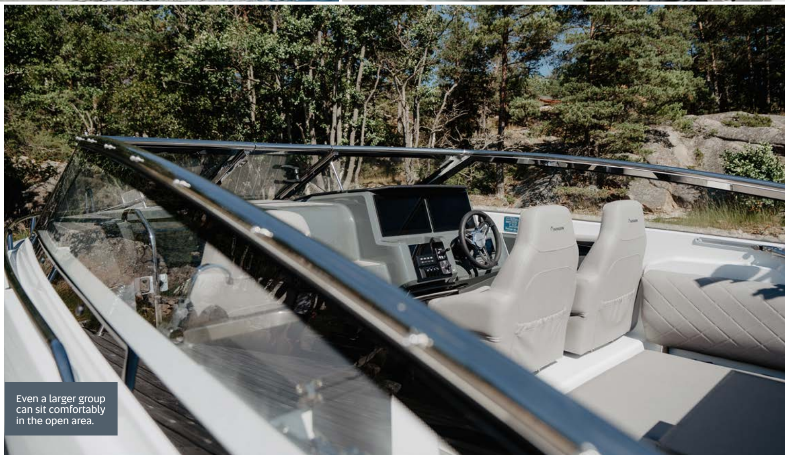
Even a larger group can sit comfortably in the open area.