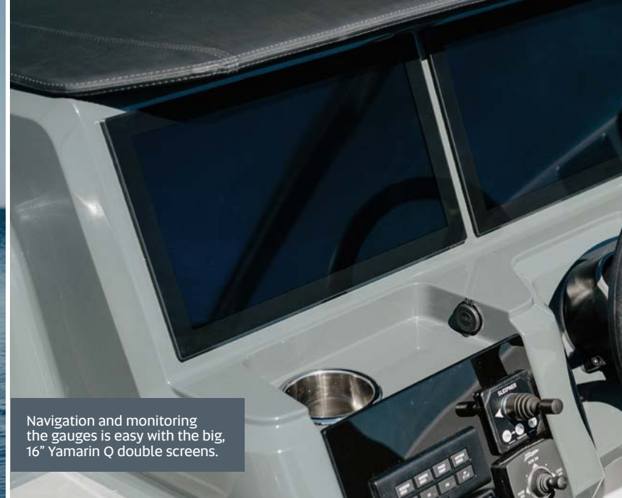
Navigation and monitoring the gauges is easy with the big, 16" Yamarin Q double screens.